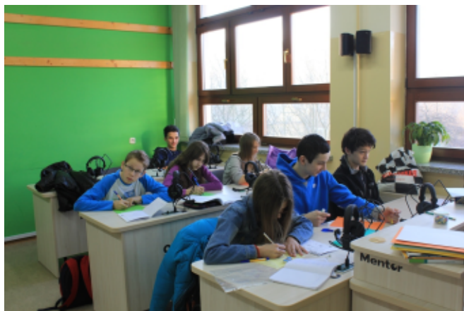
Na fot. Zajęcia w gimnazjum w Sidzinie

Z ankiet przeprowadzonych wśród uczestników projektu wynika duże zadowolenie uczniów z prowadzonych zajęć. Większość uczniów uważa, że zdobywane wiadomości i umiejętności, będą mogli wykorzystać w praktycznym działaniu. Szczególną wartość dla uczniów i nauczycieli stanowią nowoczesne pomoce dydaktyczne zakupione w ramach projektu i wykorzystywane na prowadzonych zajęciach, tablice interaktywne oraz pracownie językowe. (M.J., B.C.)