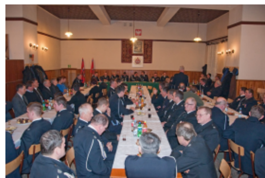
fol. Jan Motor