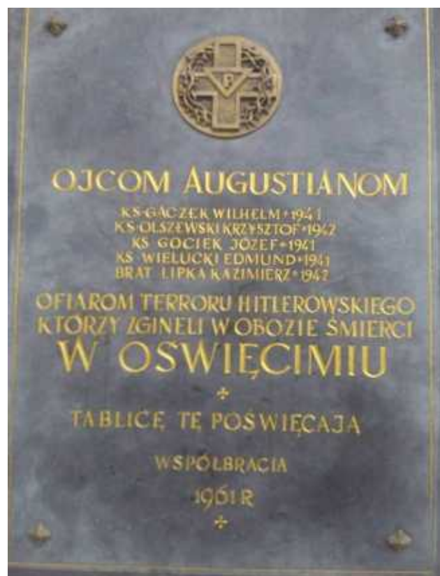
Kamienna tablica znajdująca się w Kościele św. Katarzyny w Krakowie (odsłonięta w 1961 r.), upamiętniająca zamordowanych augustianów