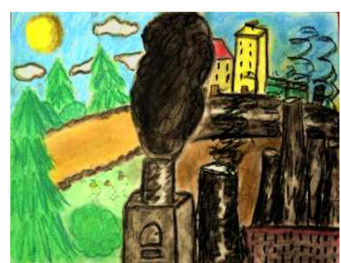
Weronika Wiertelczyk, kl. VIIC SP w Sidzinie