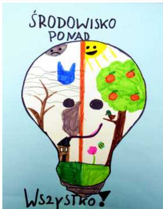
Nicolla Doll, kl. VB SP w Sidzinie