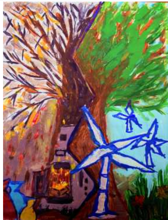
Jakub Śladewski, kl. VIIB SP w Bystrej Podhalańskiej