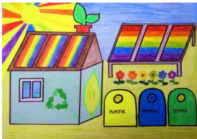
Jakub Dziubek, kl. VIIA SP w Sidzinie