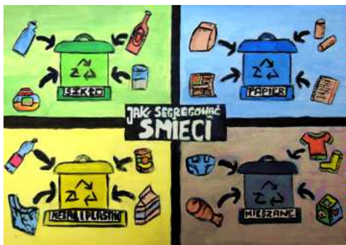
Patrycja Kostka, klasa 8B SP w Sidzinie