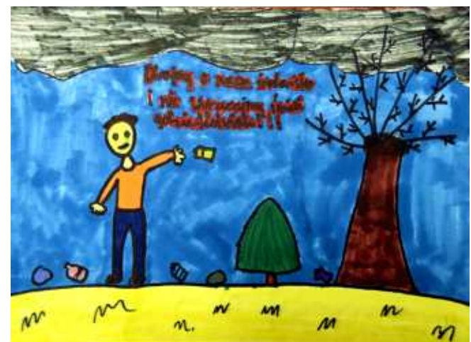
Martyna Trzop, kl. IVB SP w Sidzinie