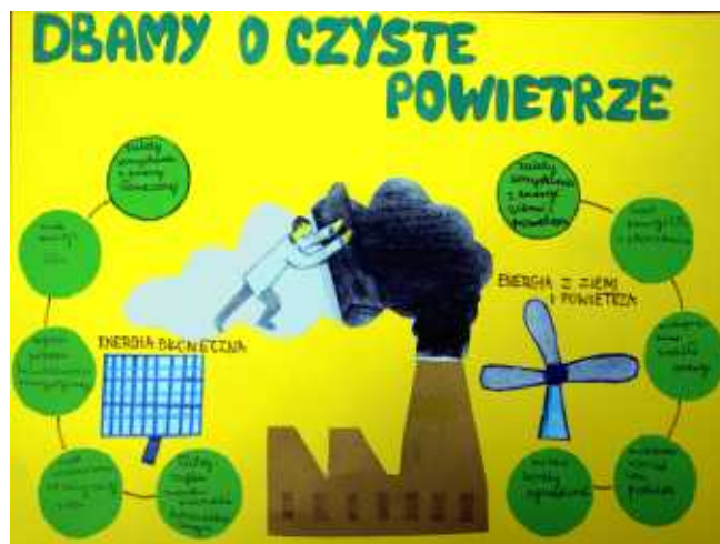
Patrycja Tempka, kl. VA SP w Sidzinie