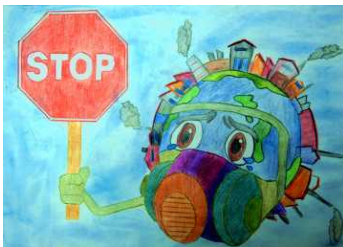
Mateusz Nieużytek, kl. VB SP w Bystrej Podhalańskiej