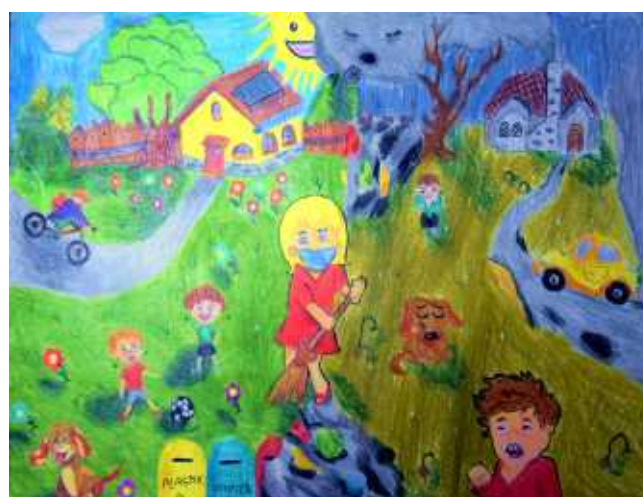
Klaudia Biedrawa, kl. VIIIA SP w Sidzinie